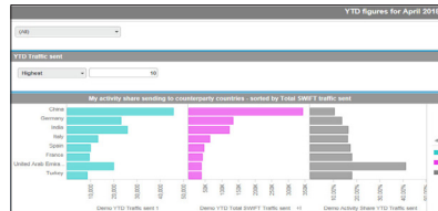
Módulo de control Trade Finance